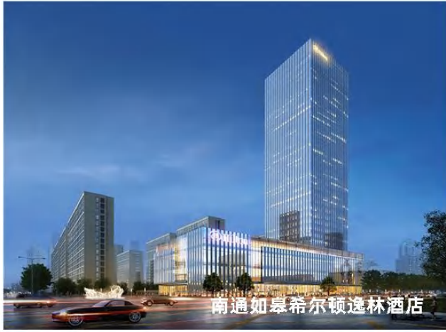
南通如皋希尔顿逸林酒店