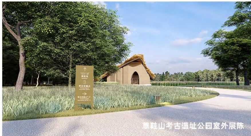
草鞋山考古遗址公园室外展陈