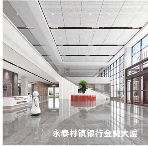
永泰村镇银行金融大厦