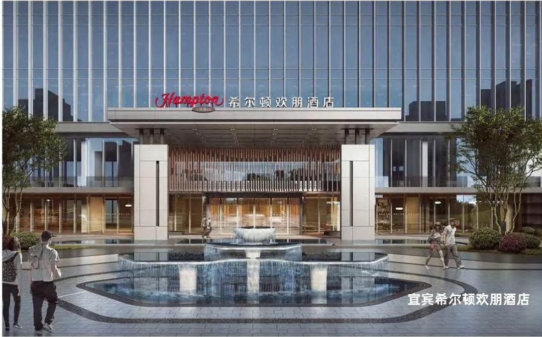
宜宾希尔顿欢朋酒店