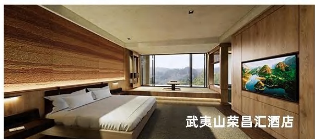
武夷山荣昌汇酒店