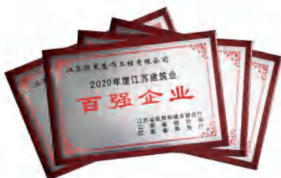
恒龙集团连续9年获此殊荣