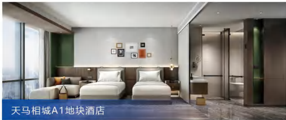
天马相城A1地块酒店