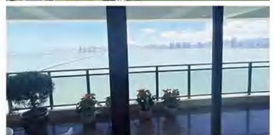
恒龙集团澳门珠海分公司办公环境