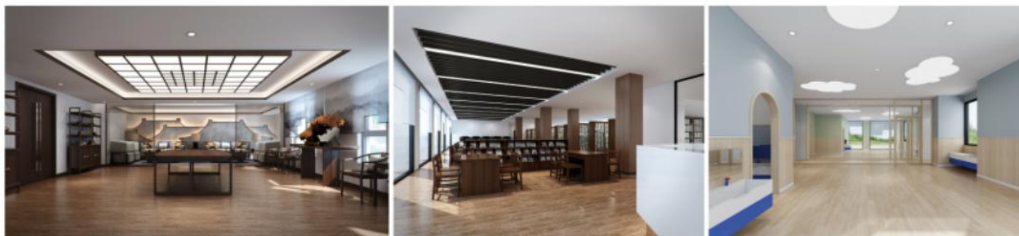
哈密路1358号活动用房